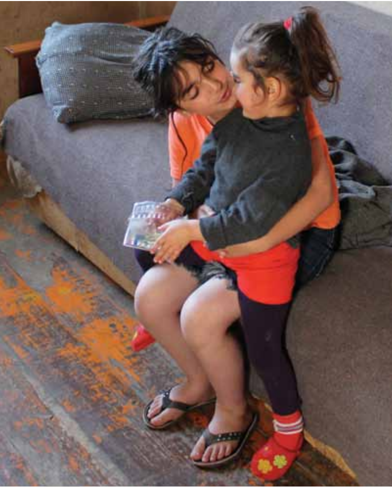
Bakıdan Şuşaya köçmüş erməni ailəsinin qızları.

gələn köçkünlər üçün ədalət digər formalarda, məsələn maliyyə təzminatı (restitusiya) formasında təmin edilməlidir.